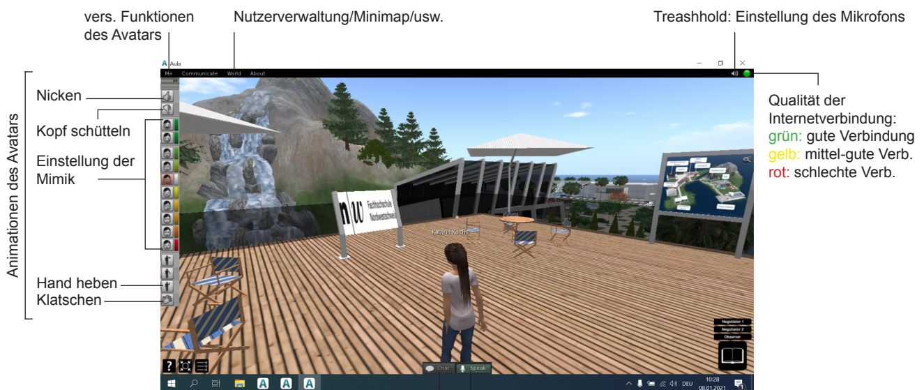
Abb. 1: Ansicht in AULA

Ein einfacher Einstieg wird mit den folgenden Bedienungen möglich.